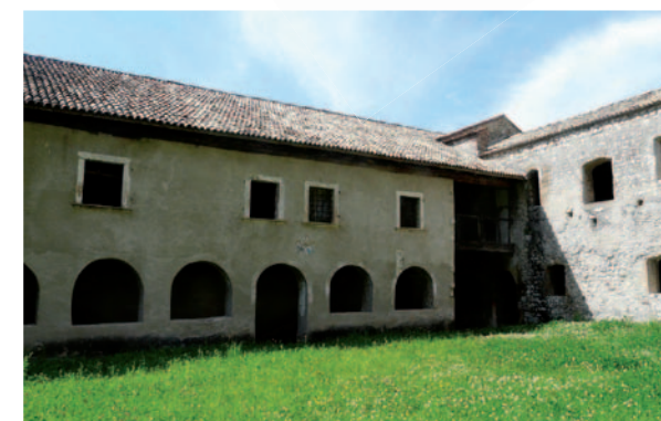
Klösterle St. Florian

Für die Spieler aller Mannschaften werden die Physiotherapeuten des „Istituto Fermi di Pergia“ zur Verfügung stehen. Per i giocatori di tutte le squadre saranno a disposizione con la propria professionalità nella preparazione fisica dei giocatori i qualificati massofisioterapisti dell'Istituto Fermi di Perugia.